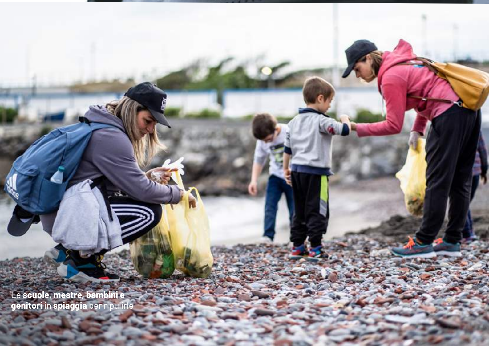
Le scuole, mestre, bambini e genitori in spiaggia per ripulirle