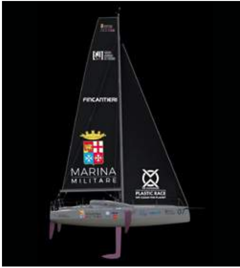
Regata Marina Militare Nastro Rosa