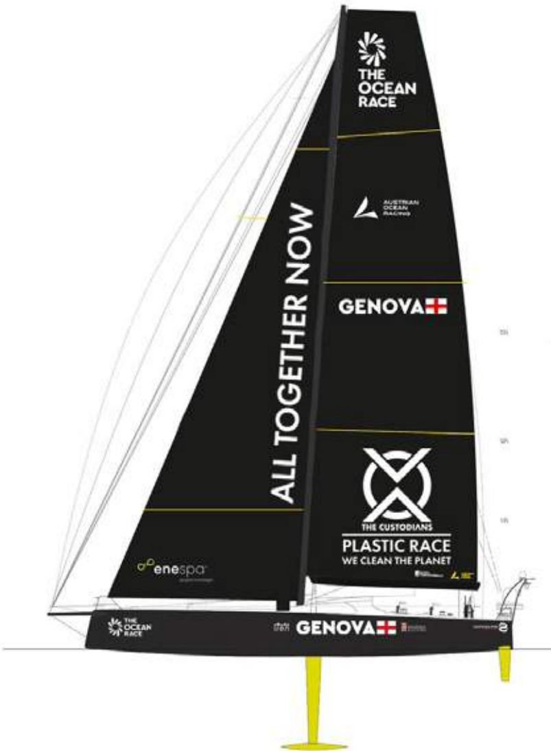
Team Genova, Austria Ocean Race