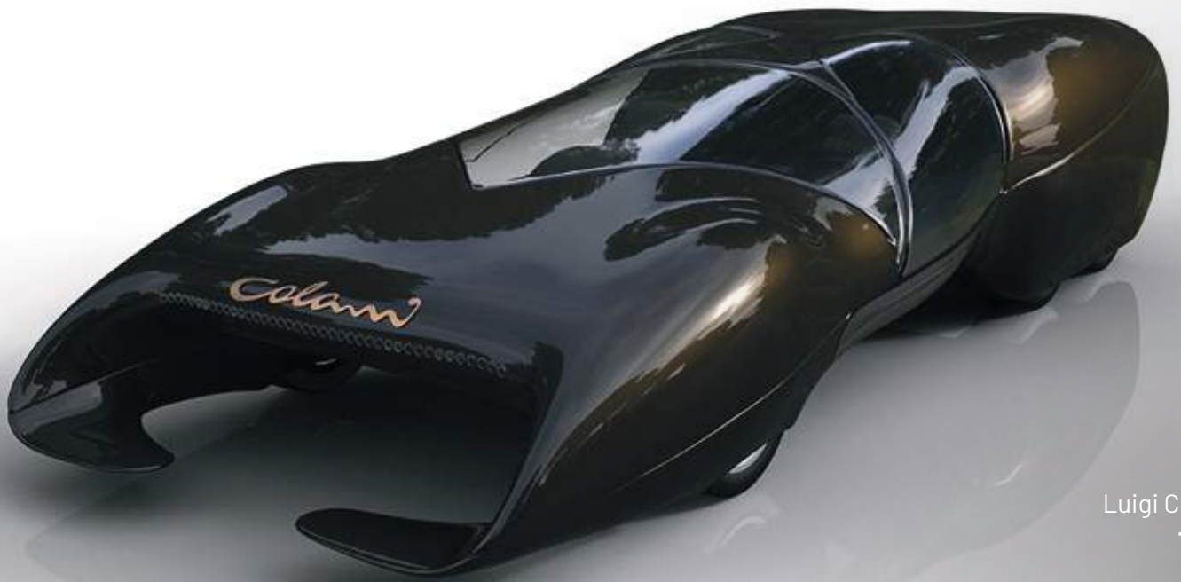
Luigi Colani T600 2017