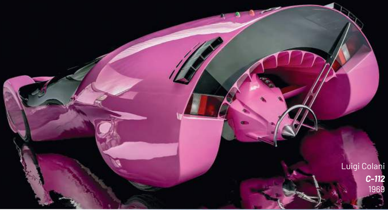
Luigi Colani C-112 1969