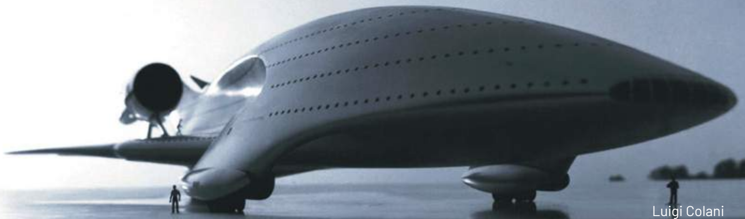
Luigi Colani Megalodon - Shark Plane 1977