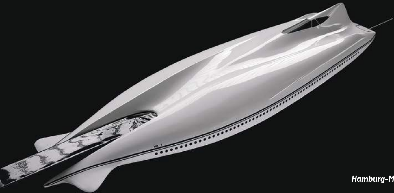
Luigi Colani Hamburg-München (HM-1) 1978

La BioDesign Foundation si basa sul lavoro e sul pensiero del grande designer e visionario Luigi Colani, che diceva che il suo lavoro era "per il 90% natura e per il 10% trasformazione Colani" . Colani sottolineava in questo modo l'obbligo per se stesso e per l'uomo di restituire alla natura, così generosa nel donare la propria ricchezza e ispirazione per le sue opere, parte dei suoi doni.