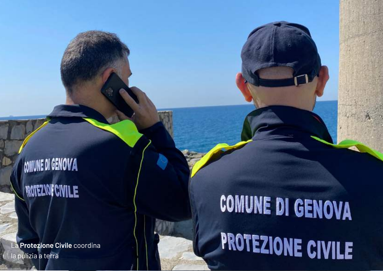
La Protezione Civile coordina la pulizia a terra